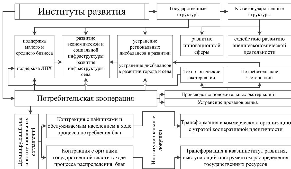
Рис. 2. Характеристика потребительской кооперации как института развития

Таким образом, увеличение экономической состоятельности организаций потребительской кооперации, ее независимость от уровня государственной поддержки, развитие законодательства, формализующего признаки и ценности кооперативной идентичности позволяют в настоящее время характеризовать потребительскую кооперацию как действующий рыночный институт. При этом его характерные черты свидетельствуют, по нашему мнению, о принадлежности объекта анализа к группе институтов развития (рис. 2).