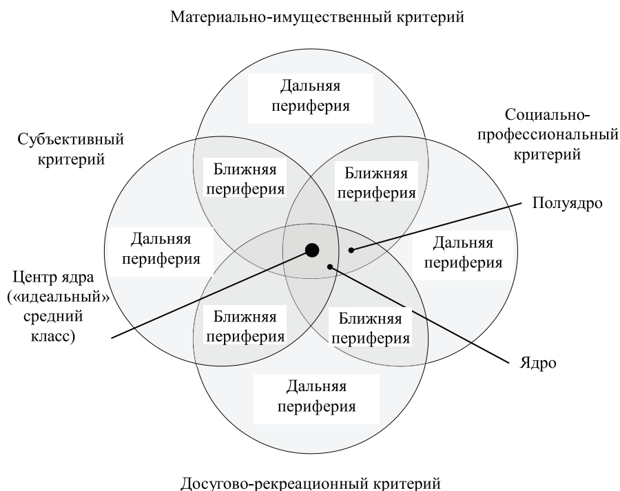
Рис. 1. Теоретическая структура среднего класса.

Эмпирические расчеты среднего класса основаны на его теоретической структуре, которая представлена в виде диаграммы Эйлера–Венна и состоит из социальных слоев, постепенно удаляющихся от центра ядра в зависимости от соответствия критериям, количество которых убывает по мере этого удаления (рис. 1).