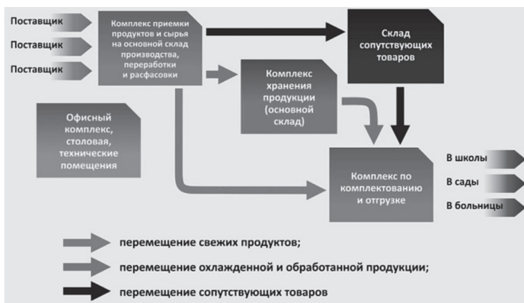
Рис. 3. Общее описание элементов модели производственно-логистического центра

Нами предлагается к рассмотрению проект «Создание производственно-логистического центра по координации производства и распространения продукции местных товаропроизводителей», концепция которого является одной из перспективных точек роста в развитии Волгограда (рис. 3).