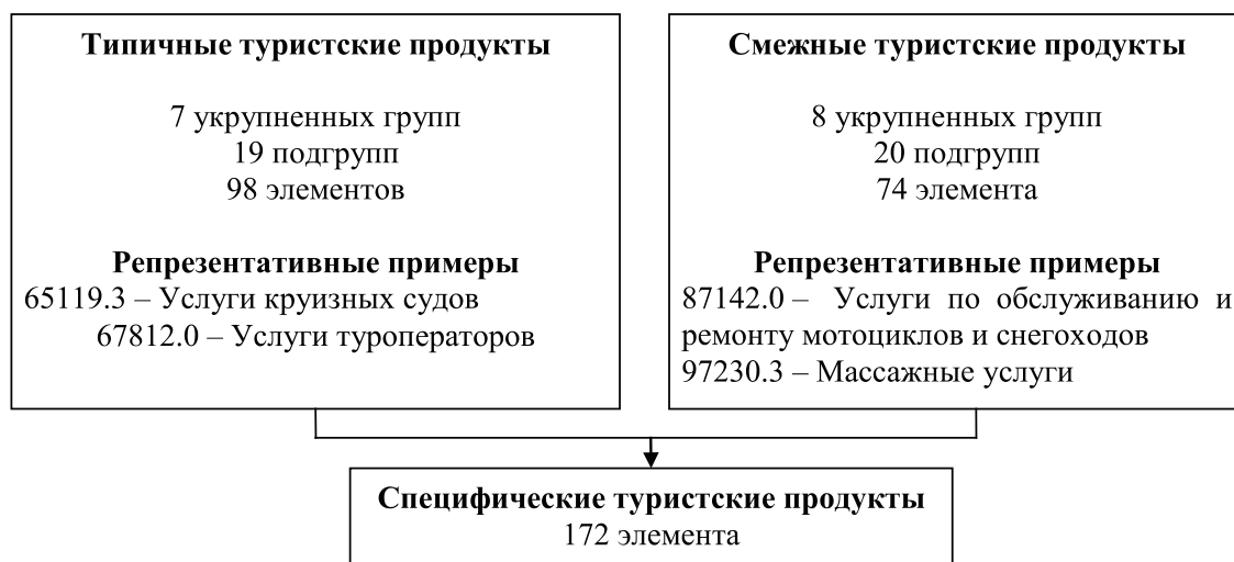
Рис. 2. Характеристики типичных и смежных туристских продуктов

Второй шаг по созданию собирательной группировки «туризм» – это формирование перечня типичных видов экономической деятельности в туристском секторе экономики. Согласно подходу UNWTO, основанному на использовании МСОК, перечень включает 12 видов деятельности, которые соответствуют 12 группам типичных туристских продуктов [2, с. 31]. К ним относятся такие виды, как размещение посетителей, обеспечение питанием и напитками, разные виды пассажирского транспорта, услуги в области культуры и т.п.