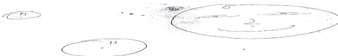
Рис. 3. Дискретная временная перспектива с ориентацией на будущее

Эта группа является разновидностью второй, поэтому ее мы условно назвали дискретной временной перспективой с ориентацией на будущее .