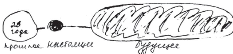
Рис. 1. Пример линейно-непрерывной временной перспективы

1. Временная перспектива, при которой значимой является зона будущего и наблюдается линейная связанность прошлого, настоящего и будущего. Эту группу мы условно назвали линейно-непрерывной временной перспективой .