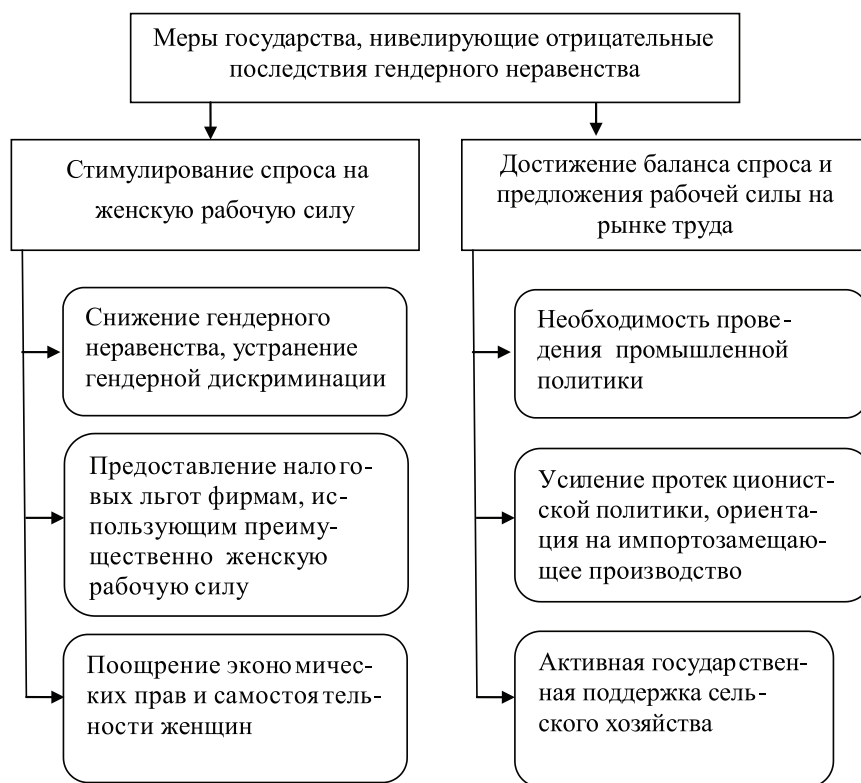
Рис. 2. Меры государственного регулирования, нивелирующие отрицательные последствия гендерного неравенства

В связи с этим нами разработаны следующие меры государства, нивелирующие отрицательные последствия гендерного неравенства (рис. 2).