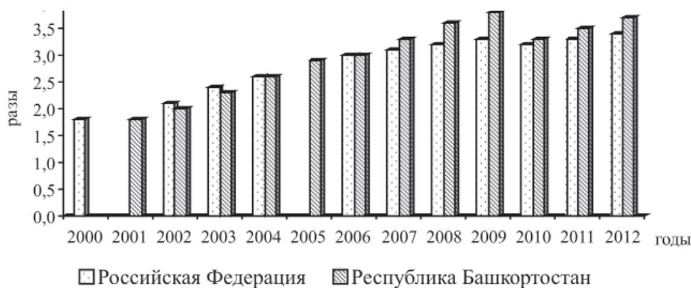
Рис. 2. Отношение среднедушевых денежных доходов населения к прожиточному минимуму (разы)

В Республике Башкортостан наблюдается общероссийская тенденция повышения отношения среднедушевых денежных доходов населения к прожиточному минимуму. За период 2001–2012 гг. данное отношение увеличилось с 1,8 до 3,7 раз (рис. 2).