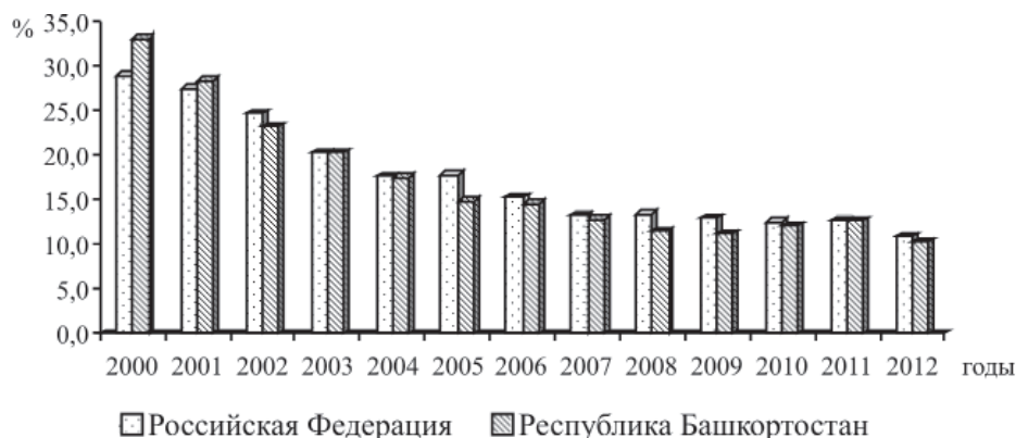
Рис. 1. Доля населения с денежными доходами ниже величины прожиточного минимума (%)

ственно уменьшилась: в 2000 г. – 29% населения, в 2005 г. – 17,8%, в 2012 г. – 10,9% [2].