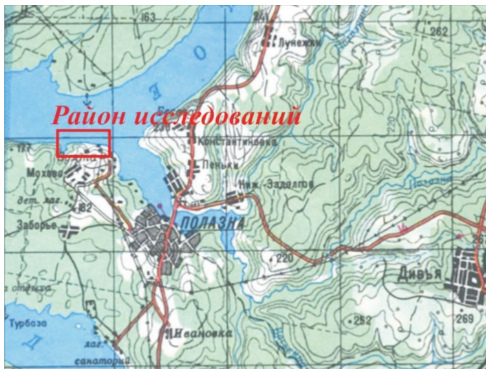
Рис. 1. Обзорная карта района работ

в 1939 г. Оно расположено в Добрянском районе Пермского края, севернее п. Полазна (рис. 1).