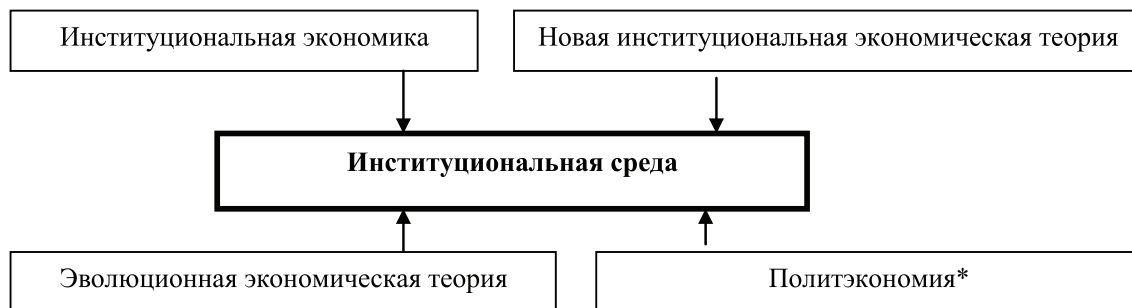
Рис. 1. Основные теории, изучающие институциональную среду 1

институциональную среду деятельности индивидов и организаций в общественном секторе и акцентирует внимание на потерях, связанных с деятельностью государства (экономика бюрократии, поиск политической ренты и т.д.).