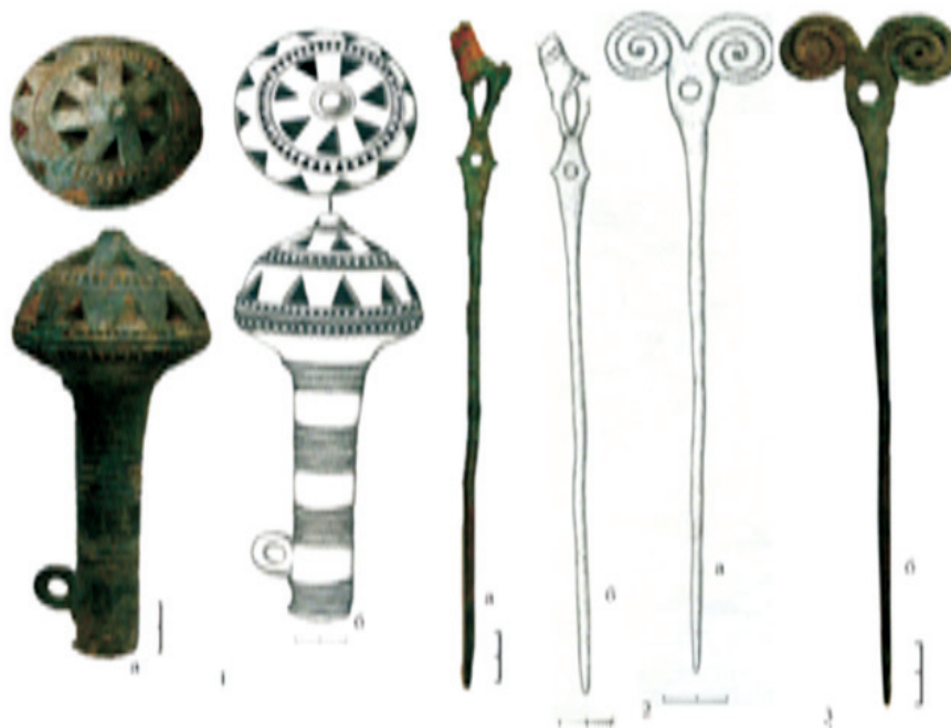
Рис. 2. Находки из Чадаколюбского святилища. Хр. у Омарова О.М.

1–6 – из святилища (по Я. Доманскому и Ю. Пиотровскому) Хр. в ГЭ; 7 – статуэтка из Чадаколюб