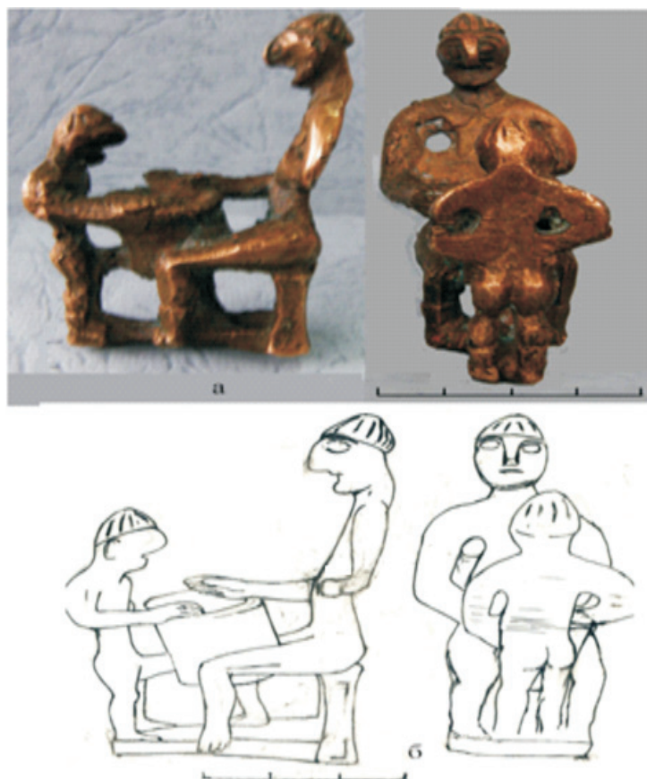
Рис. 4. Скульптурная композиция из сел. Чадаколоб: а – фотография; б – рисунок

фаллос обломан, обозначены маленькие женские груди и пупок. Голова увенчана трехзубчатым ирокезом, напоминающим корону. Уши торчат, глаза большие, подбородок острый. Статуэтка передает образ гермафродита. Высота фигуры с подставкой – 150 мм, высота статуэтки – 127 мм (рис. 1, 7).