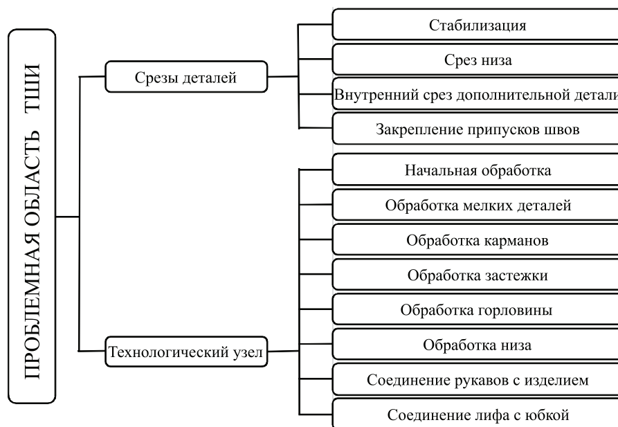
Рис. 1 Обобщенная структурная схема элементов онтологии предметной области «Технология швейных изделий»

В качестве примера результатов проведенного исследования рассмотрен класс «Срезы деталей» и подкласс «Обработка низа» класса «Технологические узлы». Построение структуры онтологии происходит по принципу соподчинения. На рис. 2 представлена структура класса «Срезы деталей», который делится на подклассы: «Срез низа» «Внутренний срез дополнительной