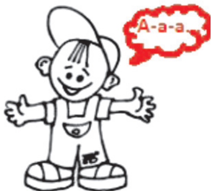
Рис. 1. Кричащий мальчик