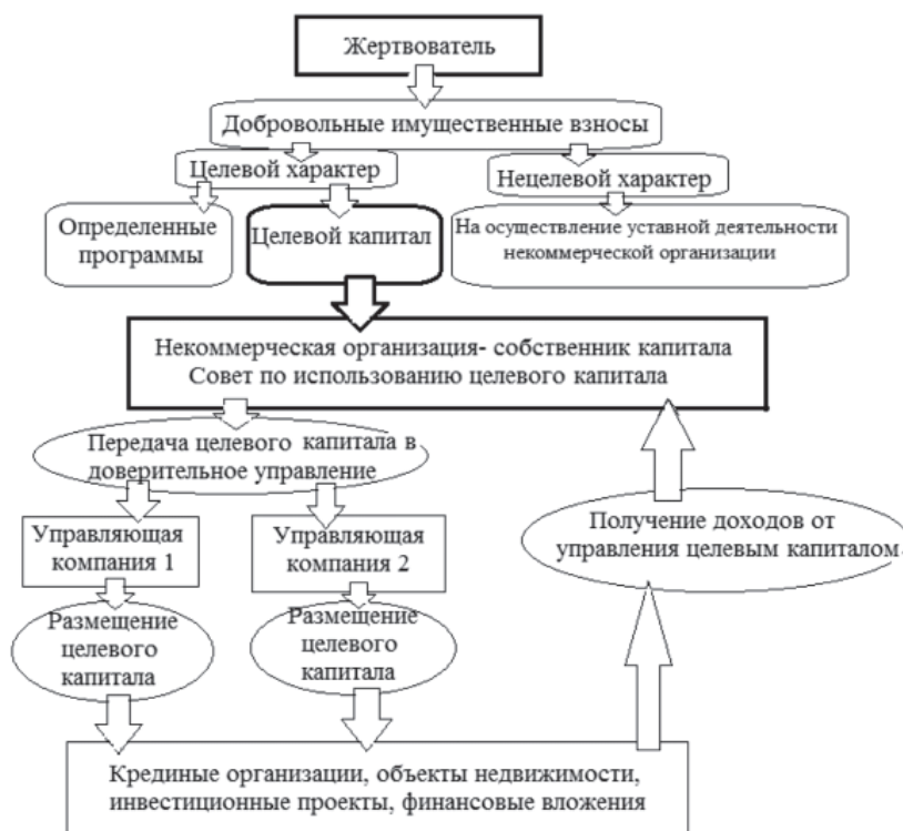
Рис. 2. Модель формирования и размещения целевого капитала некоммерческой организации

для ее реализации необходимо обеспечить условия для расширения объема и упрощения механизма пожертвований; устранить ряд административных барьеров, мешающих развитию благотворительности и добровольчества в России, разработать налоговые механизмы содействия развитию некоммерческого сектора и многое другое [5].