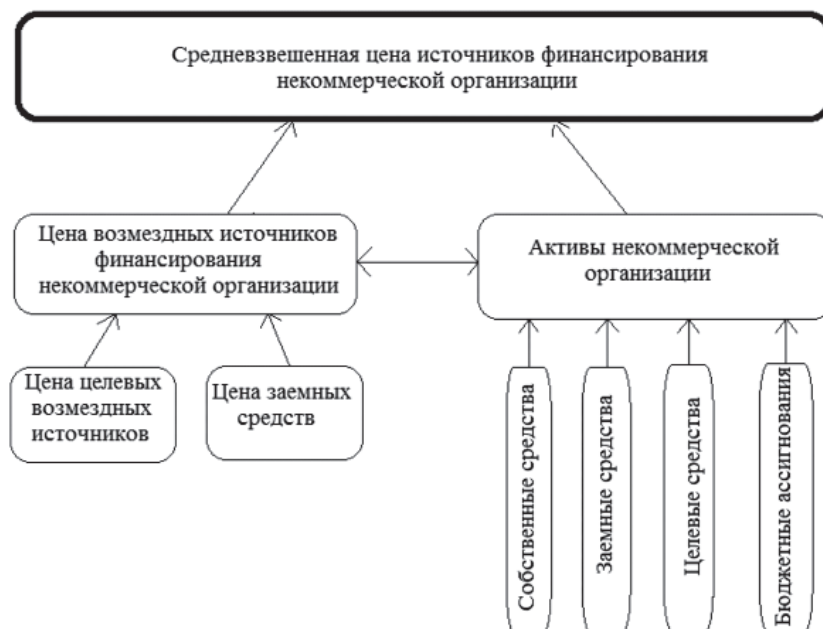
Рис. 3. Модель оптимизации структуры источников финансирования некоммерческой организации

казатель, характеризующий уровень затрат или общую сумму всех расходов, возникающих в связи с привлечением и использованием ресурсов, а в основании два показателя – цена возмездных источников и сумма активов некоммерческой организации.