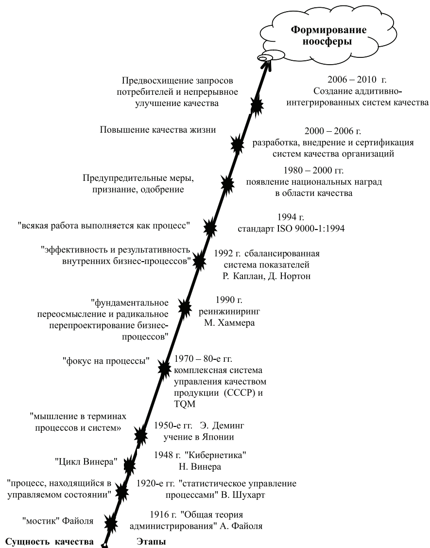
Рис. 1. Эволюция подходов к управлению качеством

ноосферой он понимал не выделенный над биосферой «мыслящий пласт», а качественно новое его состояние. Известны и более ранние переходы биосферы в подобные состояния, сопровождавшиеся почти полной ее перестройкой. Но современный переход представляет собой нечто особенное, ни с чем не сравнимое [2].