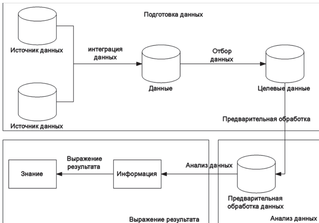
Рис. 1. Общий процесс анализа данных