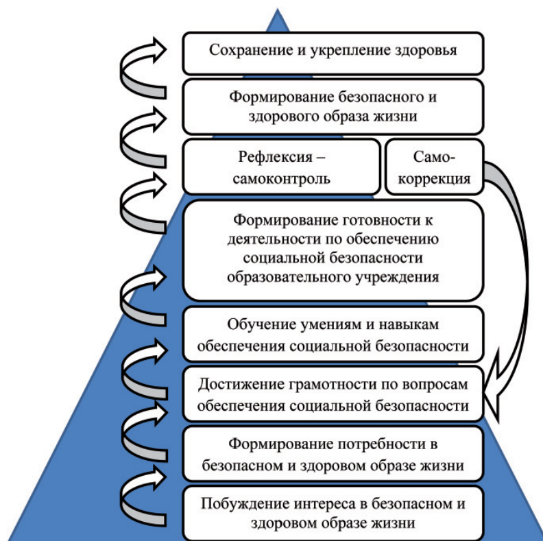
Рис. 1. Психолого-педагогический механизм формирования готовности будущего педагога к обеспечению социальной безопасности

2. Достижение грамотности по вопросам обеспечения безопасности в тревожных и экстремальных ситуациях социального характера, в том числе в условиях образовательного учреждения – формирование когнитивного компонента готовности – вооружение знаниями на занятиях и во время самостоятельной работы студентов. Показателями качества знаний по вопросам обеспечения социальной безопасности являются уровень теоретических, практических и методических знаний будущего педагога по вопросам безопасности жизнедеятельности в целом, знания о факторах, сущности и структуре безопасности жизнедеятельности в социуме, степень владения основными понятиями, категориями и закономерностями в области обеспечения социальной безопасности образовательного учреждения, знания факторов, отрицательно влияющих на здоровье участников образовательного процесса, и технологий их предупреждения. Данный компонент