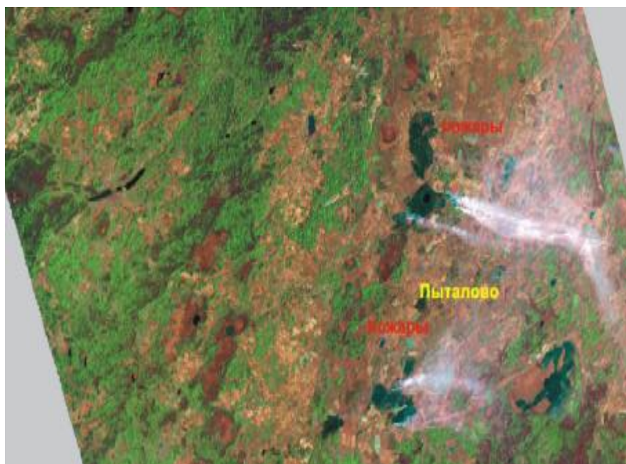
Рисунок 2. Сканированное изображение регионов России

В настоящее время от многочисленных российских и зарубежных потребителей продолжают поступать заявки на различные виды целевой информации.